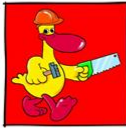
Villa letterpret beroepen De game opent in een powerpoint presentatie. Deze kan worden gedownload en verschijnt onderaan in het scherm als powerpoint icoon in beeld.