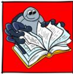
Woorden met Wim beroepen Klik op de afbeelding start film