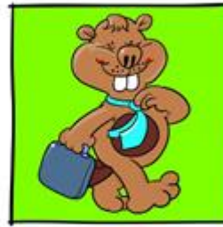
Fred van de rekenfiat beroepen